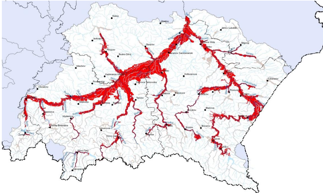
Obszary narażone na niebezpieczeństwo powodzi w regionie wodnym Górnej Wisły

Mapa regionu wodnego Górnej Wisły, na której są zaznaczone obszary narażone na niebezpieczeństwo powodzi